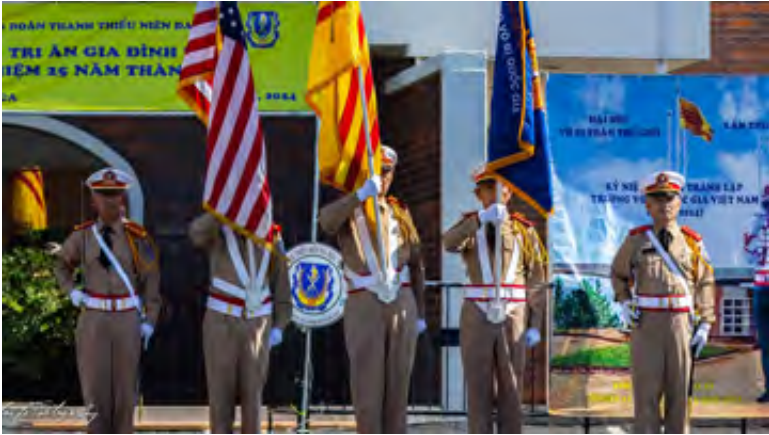
Toán Quân Quốc Kỳ của Tổng Hội CSVSQ