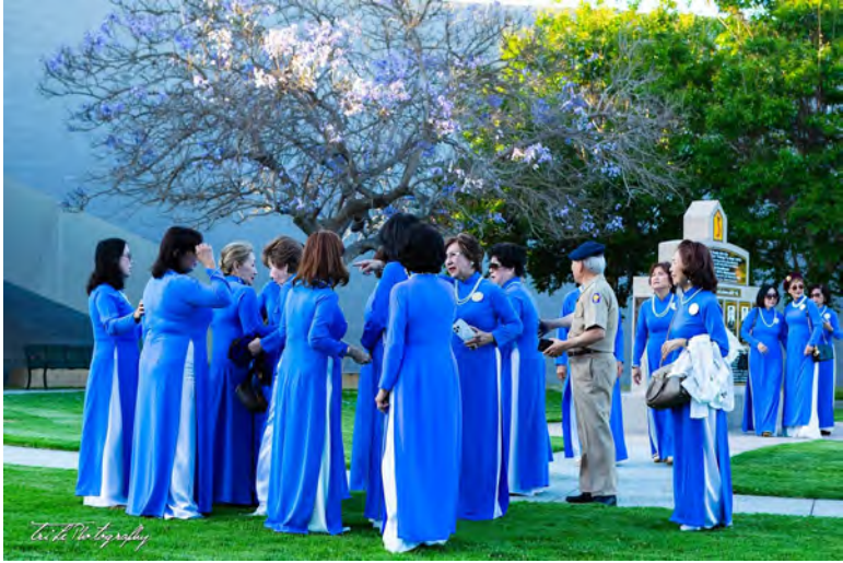
Các chị PNLV và TTNDH trước buổi lễ