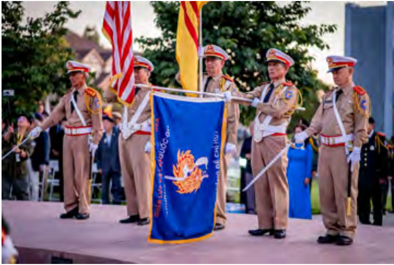
Phút mặc niệm dành cho các CSVSQ xuất thân từ Trường Võ Bị Quốc Gia Việt Nam đã vị quốc vong thân.