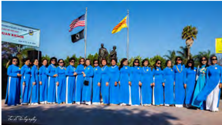
Một hình ảnh kỷ niệm của các chị PNLV và TTNDH