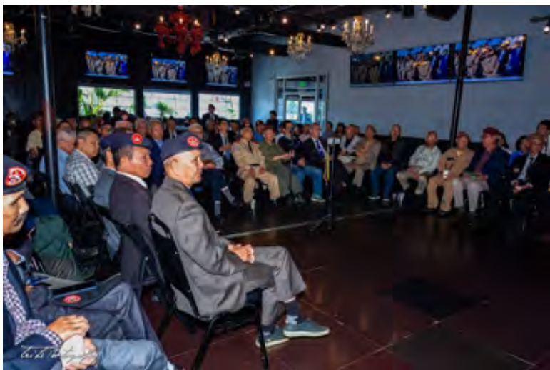
Toàn cảnh hội trường.