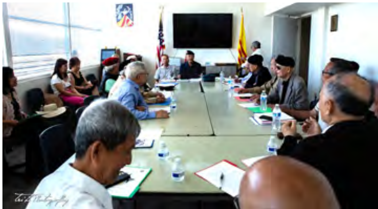
Toàn cảnh Tiền Đại Hội XXIII