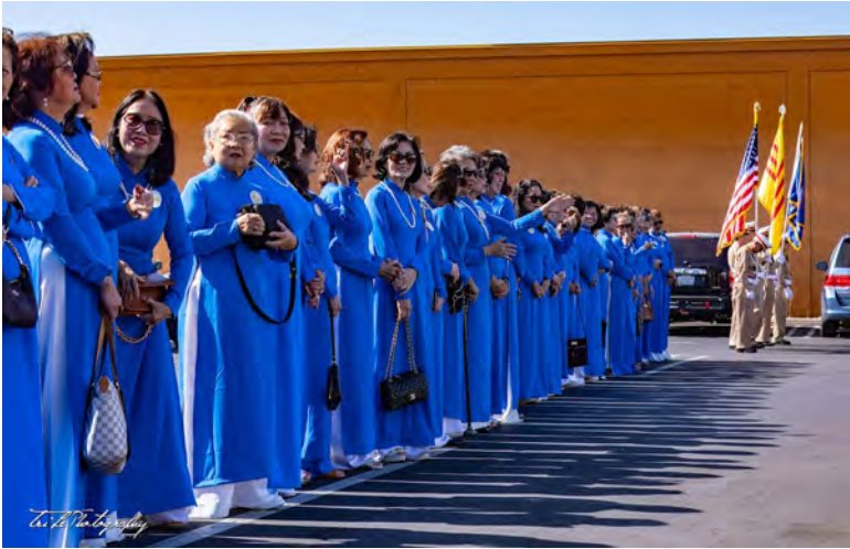
Các chị PNLV và TTNDH đang chuẩn bị đóng Quân Quốc Kỳ.