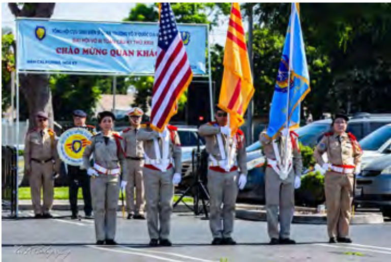
Toán Quân Quốc Kỳ của Tổng Đoàn TTNDH