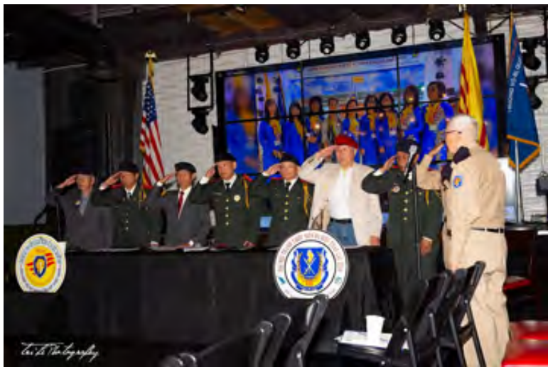
Ban Chấp Hành Tổng Hội Nhiệm Kỳ 2022-2024 tuyên bố chấm dứt nhiệm kỳ.