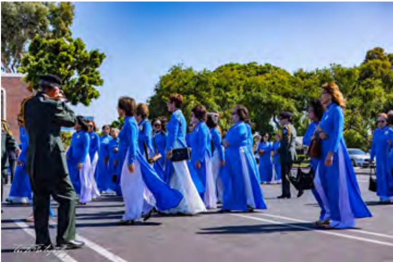
Sau lễ chào cờ